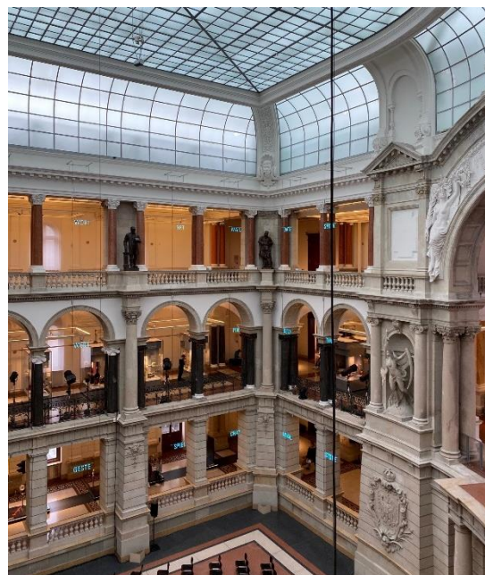
Museum für Kommunikation.