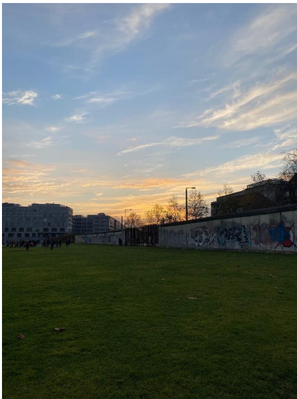
Mindesmærke for Berlinermuren