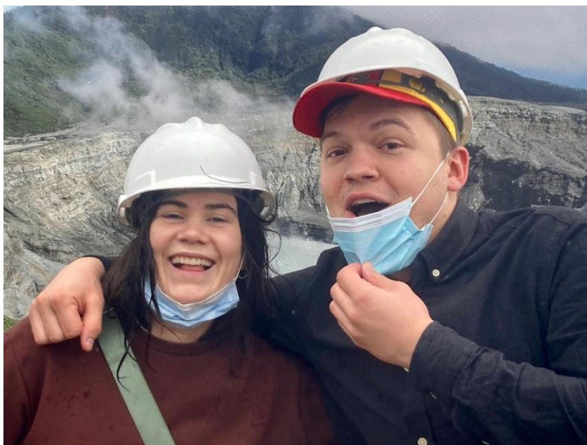
Læg gerne mærke til baggrunden på dette billede... Evt. de mange regndråber.

Da vi stod af bussen i 2700 meters højde, tæt på toppen af vulkanen, blev vi mødt af støvregn og en frisk til hård brise. Der var tåget, det regnede en smule, men humøret var højt, og vi gik glædeligt ind og fik en kort sikkerhedsbriefing. Derefter var det på med sikkerhedshjelm, og ud på en lille vandretur op af bjerget hen til udkigsposten.