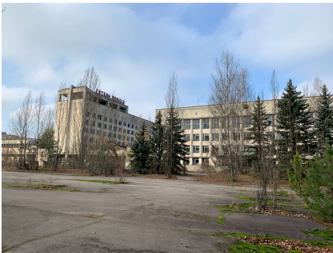
Den nu forladte by Pripjat tæt på Tjernobyl.

Næste morgen blev vi alle hentet i en slags minivan foran vores hostel, hvorefter vi blev kørt langt pokker i vold ud mod den grå intethed, som det Ukrainske landskab bedst kan beskrives som. Der var dog mening med den ubehagelighed, som det var at køre ud ad fortsat mindre og mere hullede ukrainske veje.