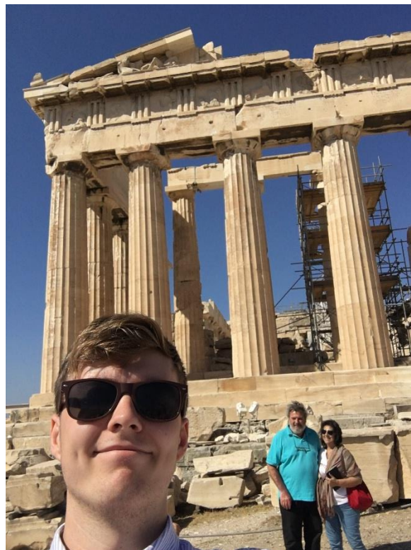
Et styks praktikant foran Parthenon. Athenes tempel.

Efter ambassadøren var vi på byvandring med en lokal guide, der både gav os en gennemgang af de historiske steder, men også gav et billede af, hvordan de indfødte og specielt den yngre generations bekymringer og tro på eget land. Hun kom også ind på en pointe, ambassadøren havde fortalt os. Siden krisen er over 700.000 uddannede mennesker forladt landet med de godt 11 millioner mennesker for at få bedre levevilkår. Det såkaldte 'Brain drain'.