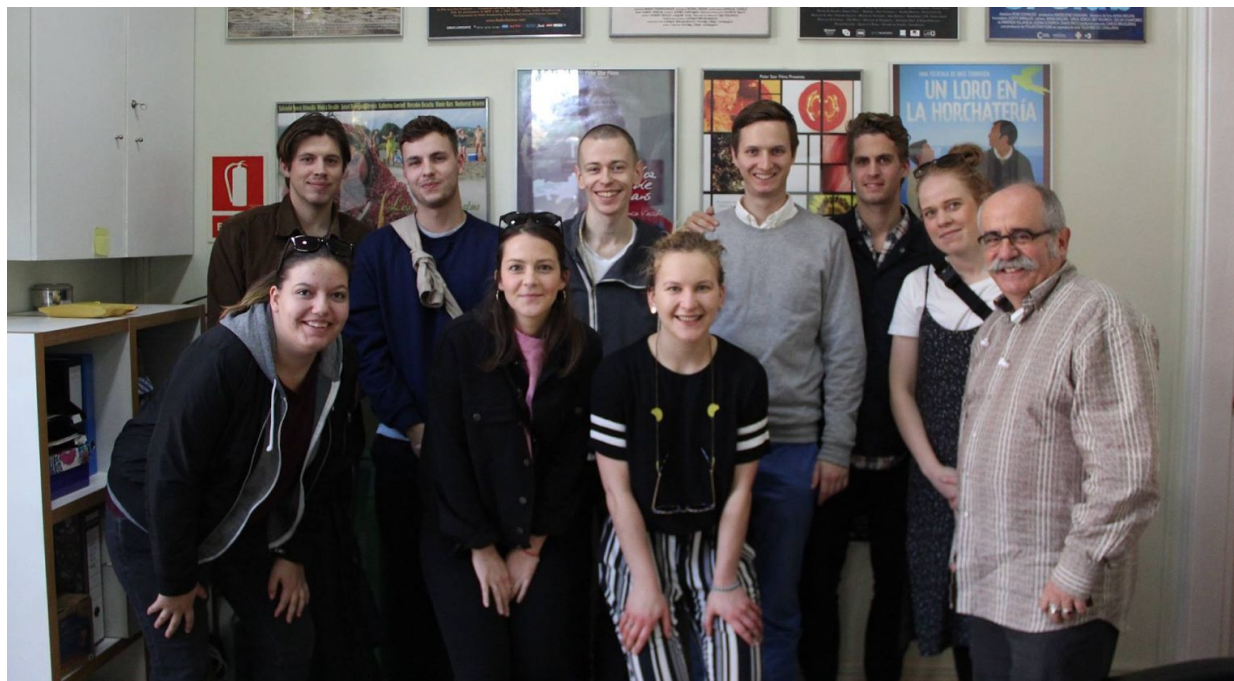
Tak for støtten, DJ - den er værdsat